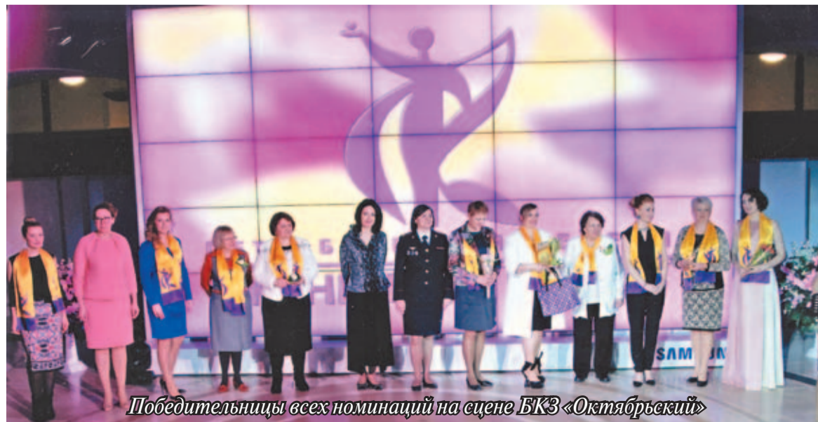
Победительницы всех номинаций на сцене ВКЗ «Октябрьский»

«Несломленные», «Расскажи мне о себе». Теплота и сердечное отношение к людям помогли ей раскрыть судьбы многих женщин, наших соратников по ветеранскому движению. Ее деятельность на заводе была оценена высоким званием Героя Социалистического Труда. В советский период была избрана депутатом Верховного Совета СССР, членом Комитета советских женщин. Сегодня она активно работает в Комитете Героев Социалистического Труда. Своим жизненным опытом она