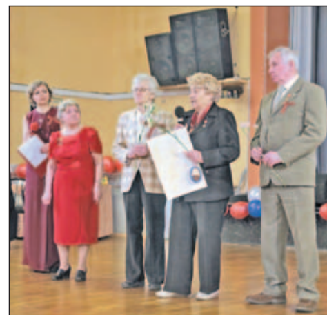
ВЫБОРГСКИЙ — РАЙОН ТРУДОВОЙ СЛАВЫ