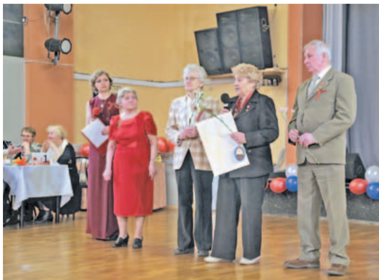
Праздник Весны и Труда

привлечению молодых рабочих к себе. Совет ветеранов Выборгского района единственный в городе