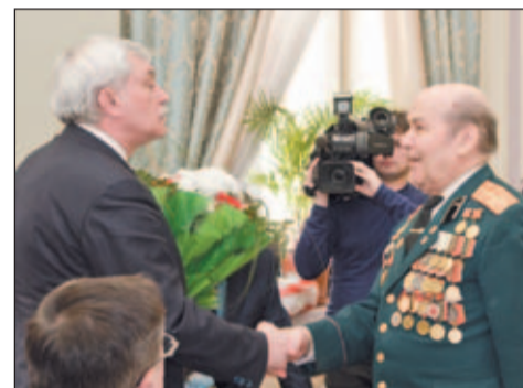
ВСТРЕЧА ВЕТЕРАНОВ С ГУБЕРНАТОРОМ САНКТ-ПЕТЕРБУРГА СТР. 2