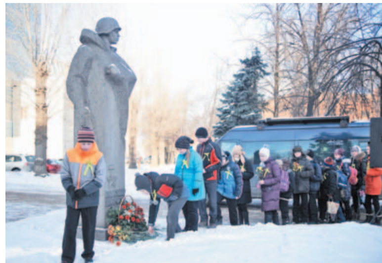
У памятника Александру Матросову

Вступают и другие ветеранские организации, например, в прошлом