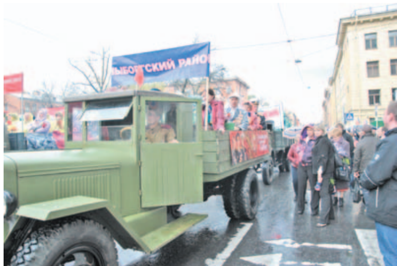
9 мая 2014 года. Колонна Выборгского района