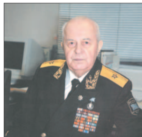
ЗАЩИТНИК ОТЕЧЕСТВА СТР. 3