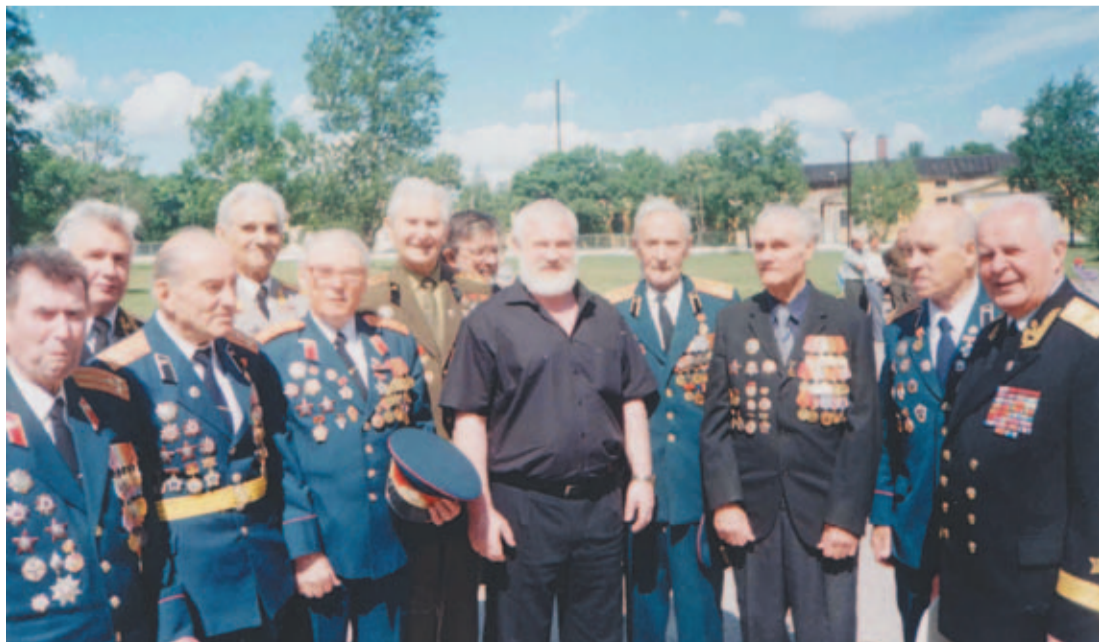
Члены Клуба кавалеров ордена Александра Невского